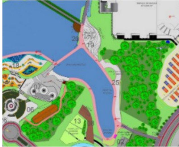
Figura 2 – Implantação / Localização Vila das Nações (página 3).

Será ampliado o lago até a área do monumento?