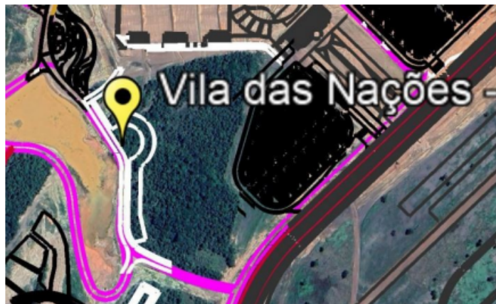
Figura 1 – Implantação / Localização Vila das Nações (página 2).

O local da implantação do monumento seria toda a área demarcada ou somente a área central?