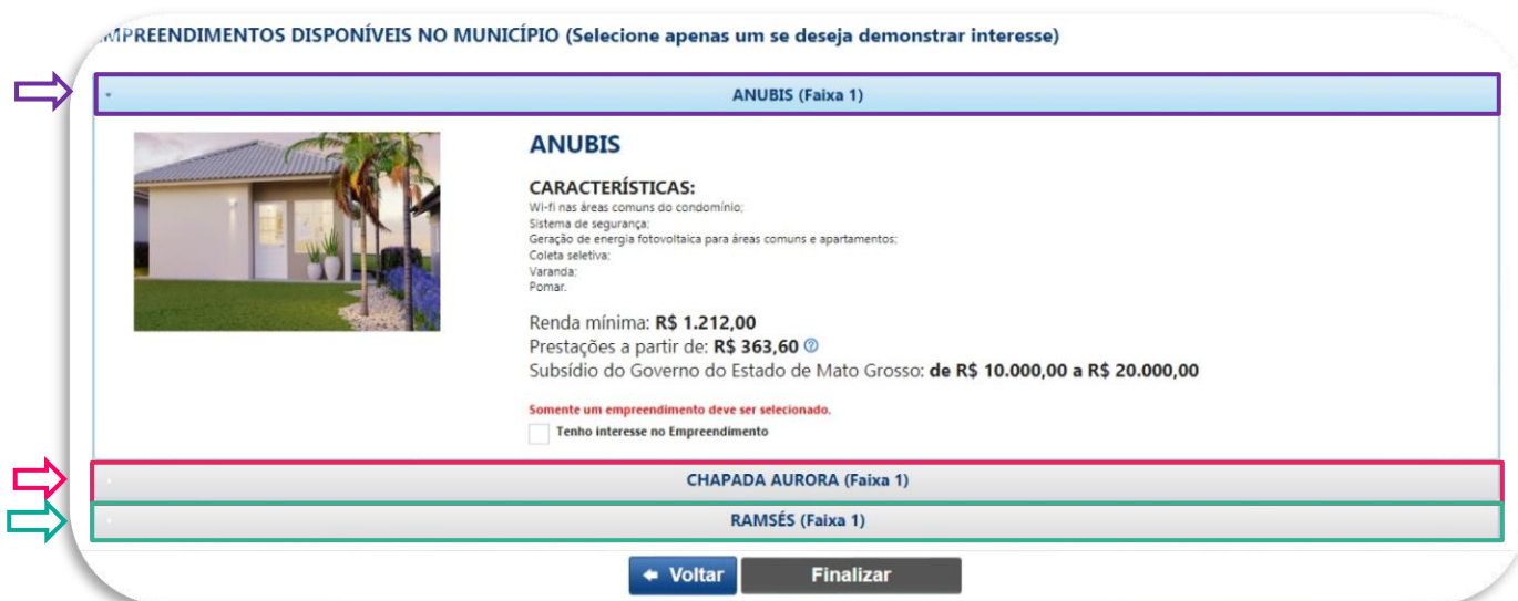
Figura 09: Página SiHabMT – Manifestação de Interesse