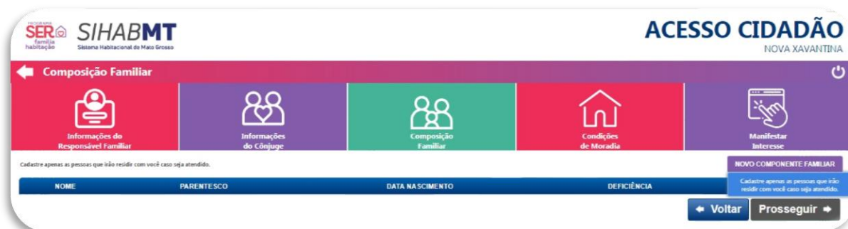
Figura 06: Página SiHabMT – composição familiar