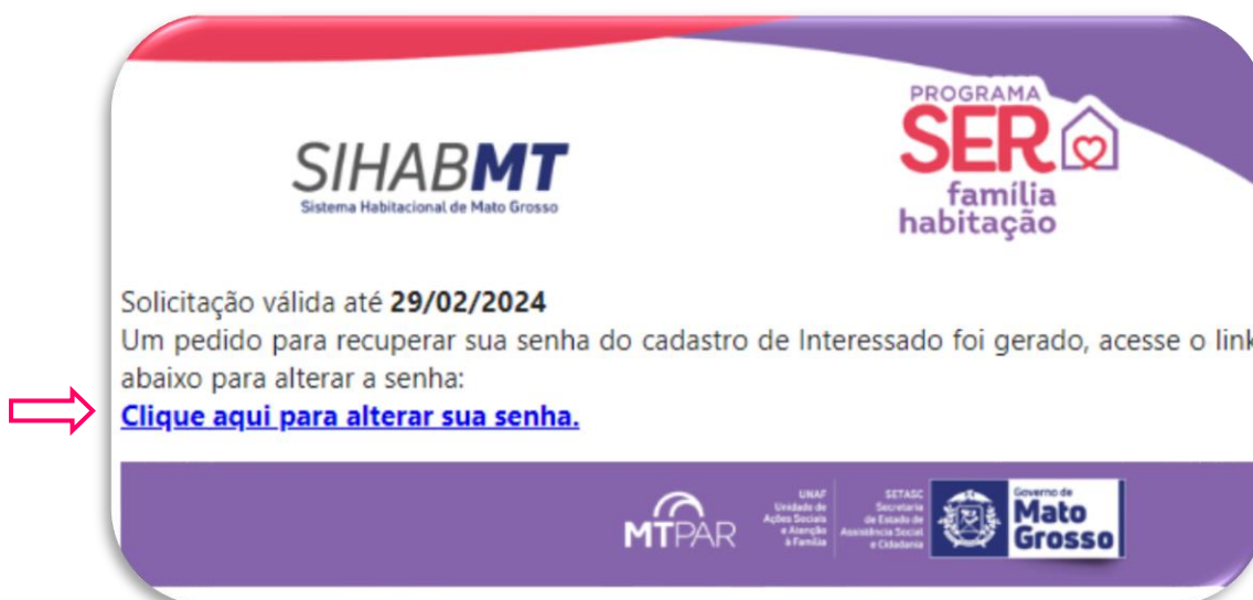
Figura 03: Página de e-mail